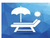
Ombrelloni e Lettini