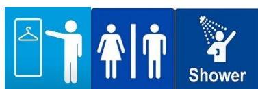
Spogliatoi e Servizi

Tutti i soci potranno usufruire dei seguenti servizi, che verranno ampliati nel corso del tempo.